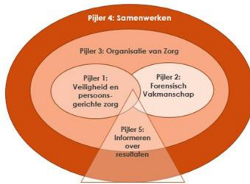
Figuur 2 Kwaliteitskader forensische zorg in 5 pijlers